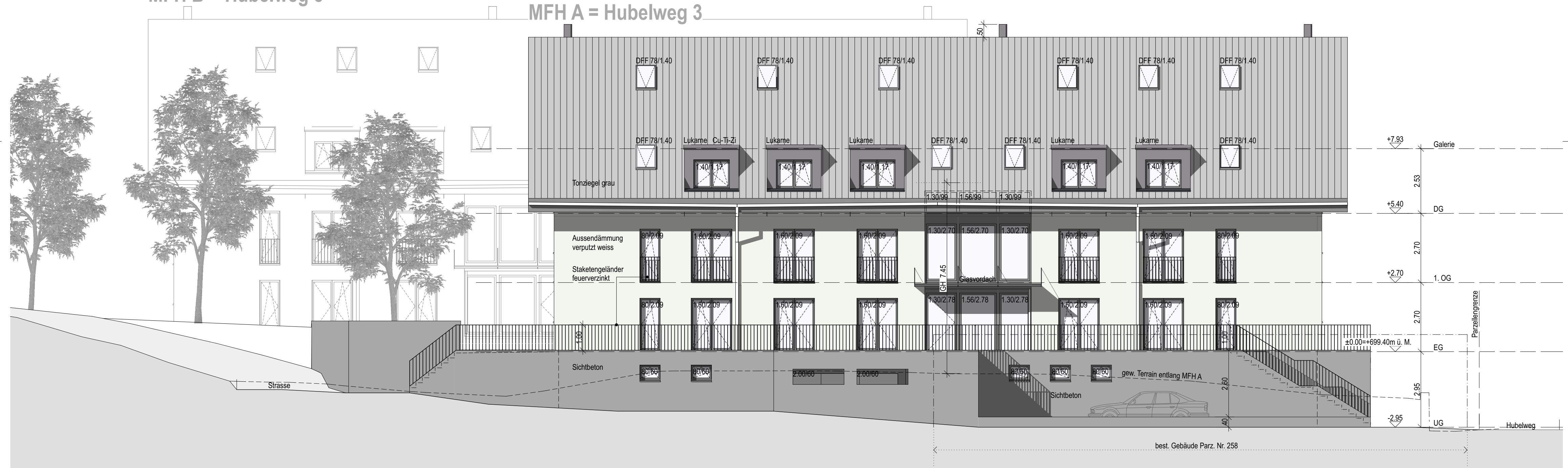
Ansicht Nordost vor Grenzmauer